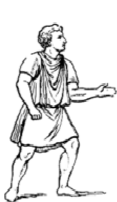
Bild 1: tunica

s 28: trirem : treroddsfartyg, se bild 4.